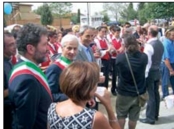
Dopo il taglio del nastro comincia la festa vera e propria, con la visita alla struttura da parte dei cittadini, mentre la Banda suona