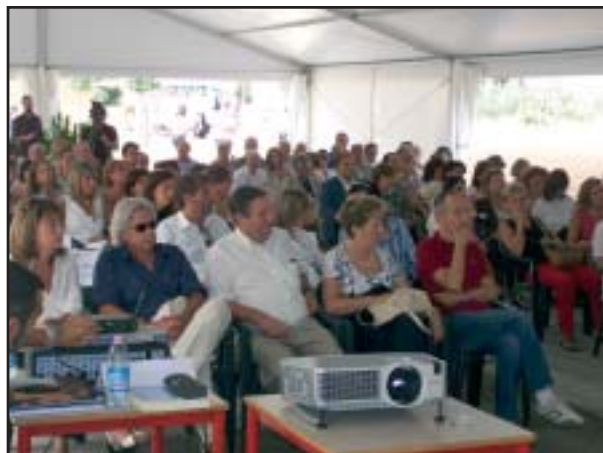
Tante le persone presenti: autorità e famiglie. L'asilo nido è la prima importante opera pubblica realizzata a Barberino dagli Anni Cinquanta