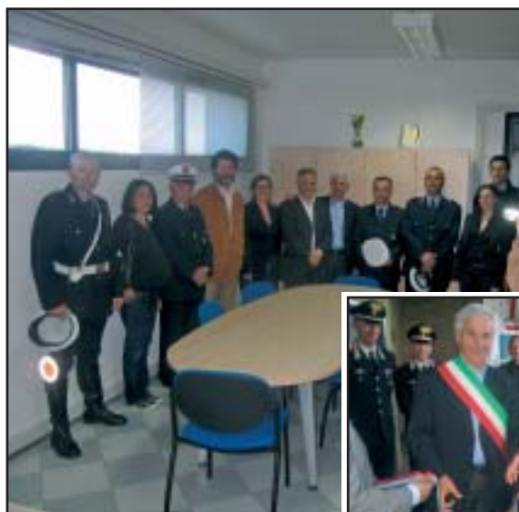
Due momenti dell'inaugurazione della nuova centrale operativa di via Cassia

Maggiore presenza e più controllo del territorio, più servizi, più vicinanza ai cittadini, più prevenzione e più controllo: dal primo luglio è operativa la gestione unificata della polizia municipale di Barberino e Tavarnelle. E i frutti non hanno tardato a rendersi evidenti: «Nonostante l'avvio del periodo estivo, e quindi con la necessità di fare i conti con le ferie, abbiamo aumentato la pre-