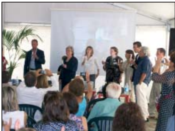
Uno dei momenti più toccanti dell'inaugurazione: si spengono le candeline del Melograno e si accendono quelle del Melarancio